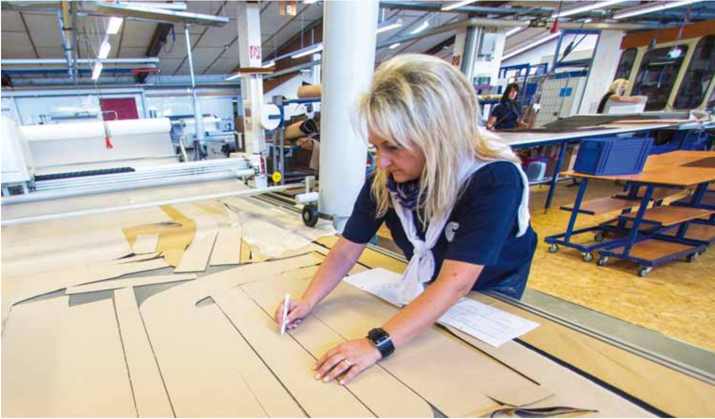
Der perfekte Schnitt wird selbstverständlich von Hand vorbereitet