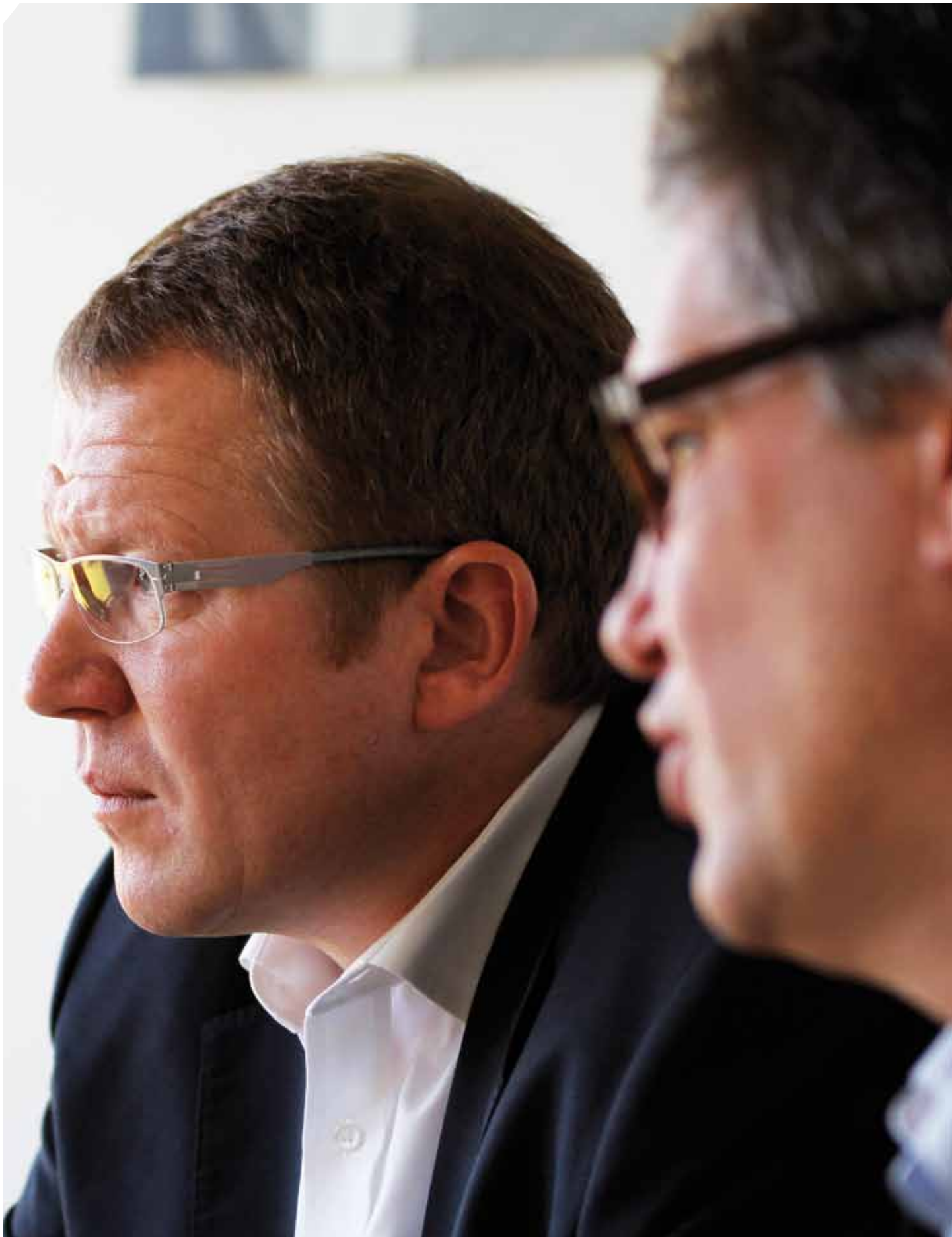
Die HYMER-Geschäftsführer beim Interview – konzentriert und gewissenhaft wie immer