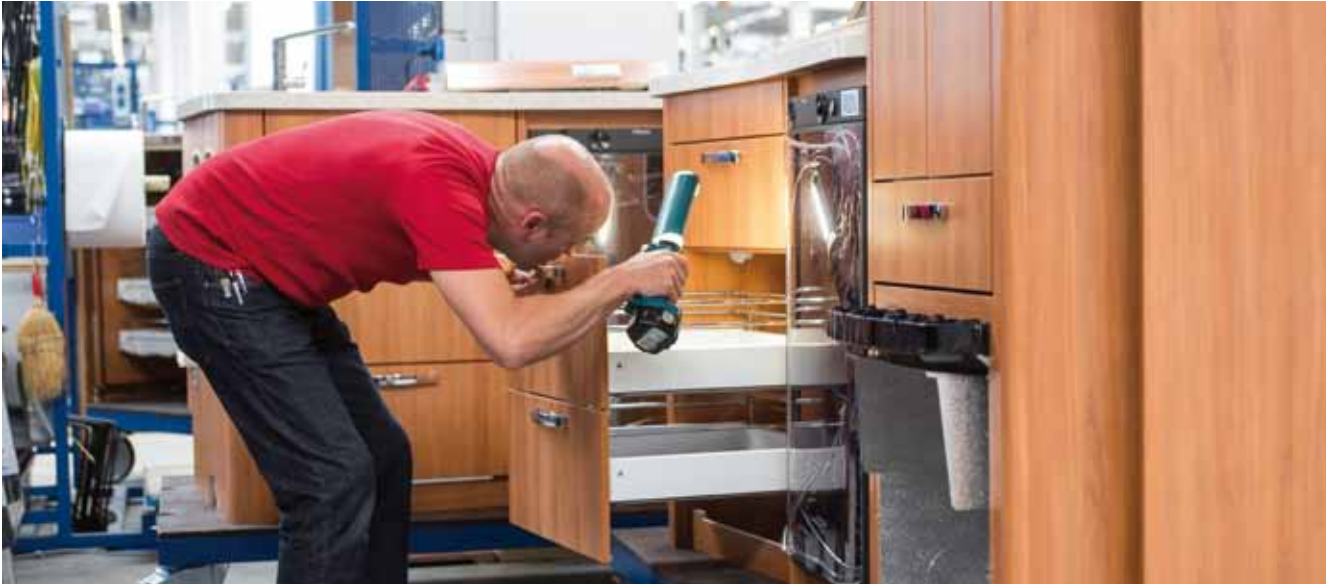
Die Qualitätskontrolle erfolgt während des gesamten Fertigungsprozesses

sämtliche Abweichungen während der einzelnen Schritte erfasst, sodass jederzeit überprüft werden kann, ob die Fehler behoben sind und ob das Fahrzeug letztlich nach Vorgabe gebaut wurde.