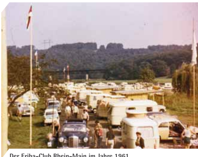
Der Eriba-Club Rhein-Main im Jahre 1961