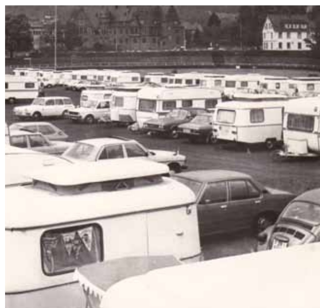
Der Eriba-Club Rhein-Main Ende der 1960er-Jahre

www.hymer.com erfahren. Klicken Sie einfach auf den Clubnamen in der Landkarte oder fordern Sie weitere Infos über das darunter liegende Kontaktformular an. Die Informationen werden ständig gepflegt und die angegebenen Termine sind immer aktuell. ■