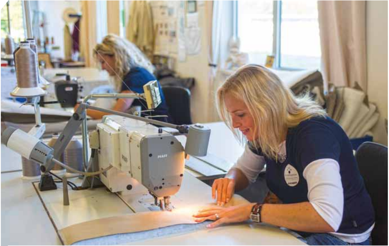
Handarbeit in der HYMER-Polsterei