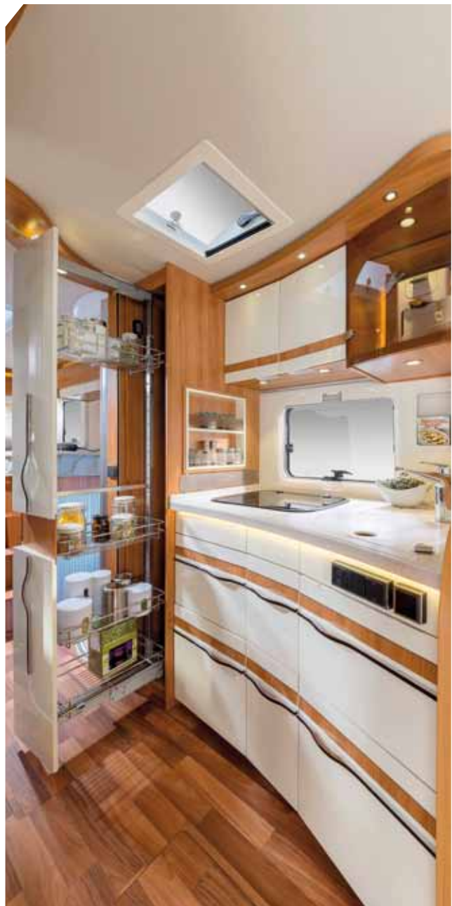
Ein überwältigendes Raumangebot

Glasfaserverstärkter Kunststoff (GFK) schützt Dach und Unterboden vor Hagel- bzw. Steinschlag. Wem es in Griechenland, Spanien oder Portugal langsam zu heiß wird, der ist mit