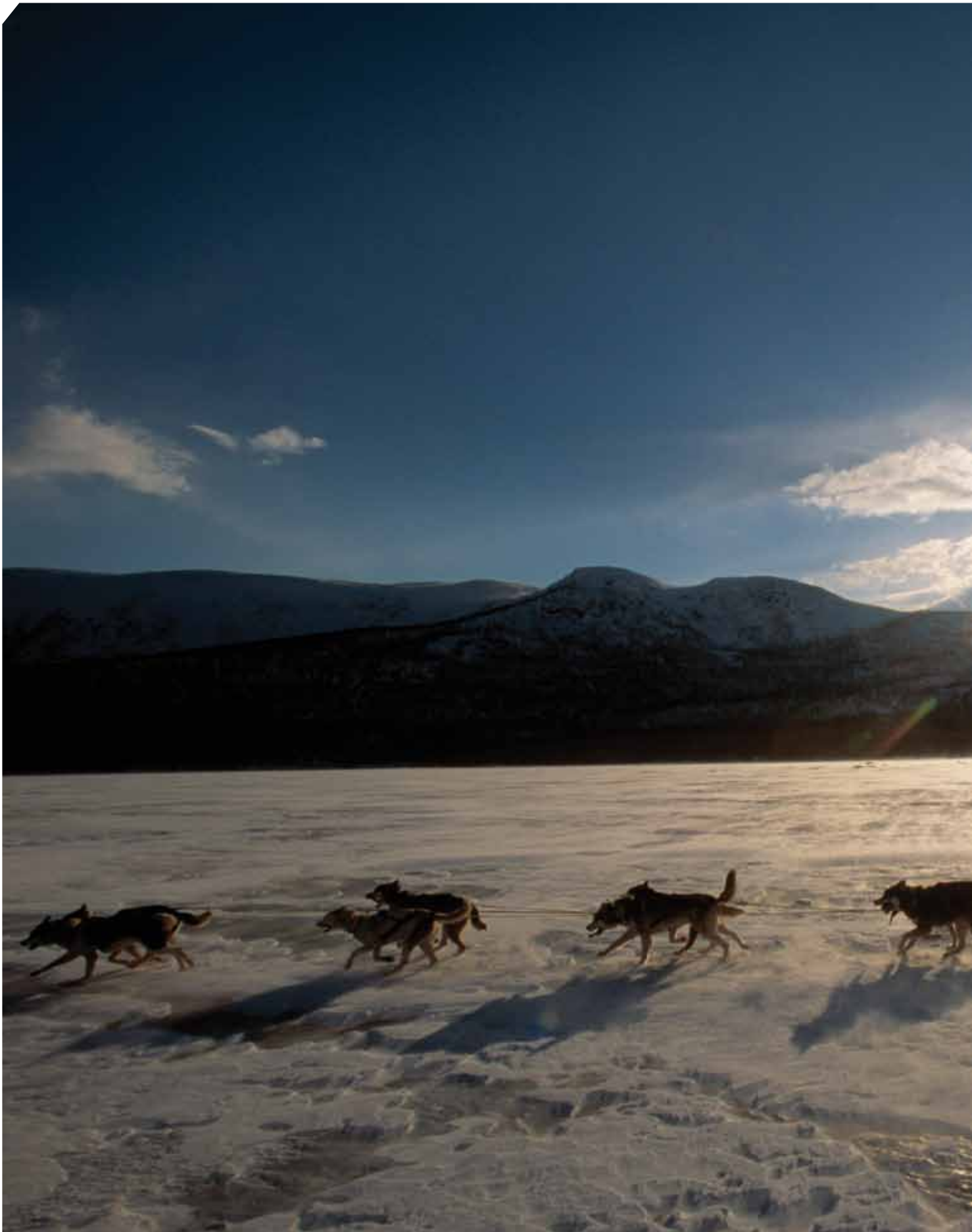
Schweden - ein Traumland