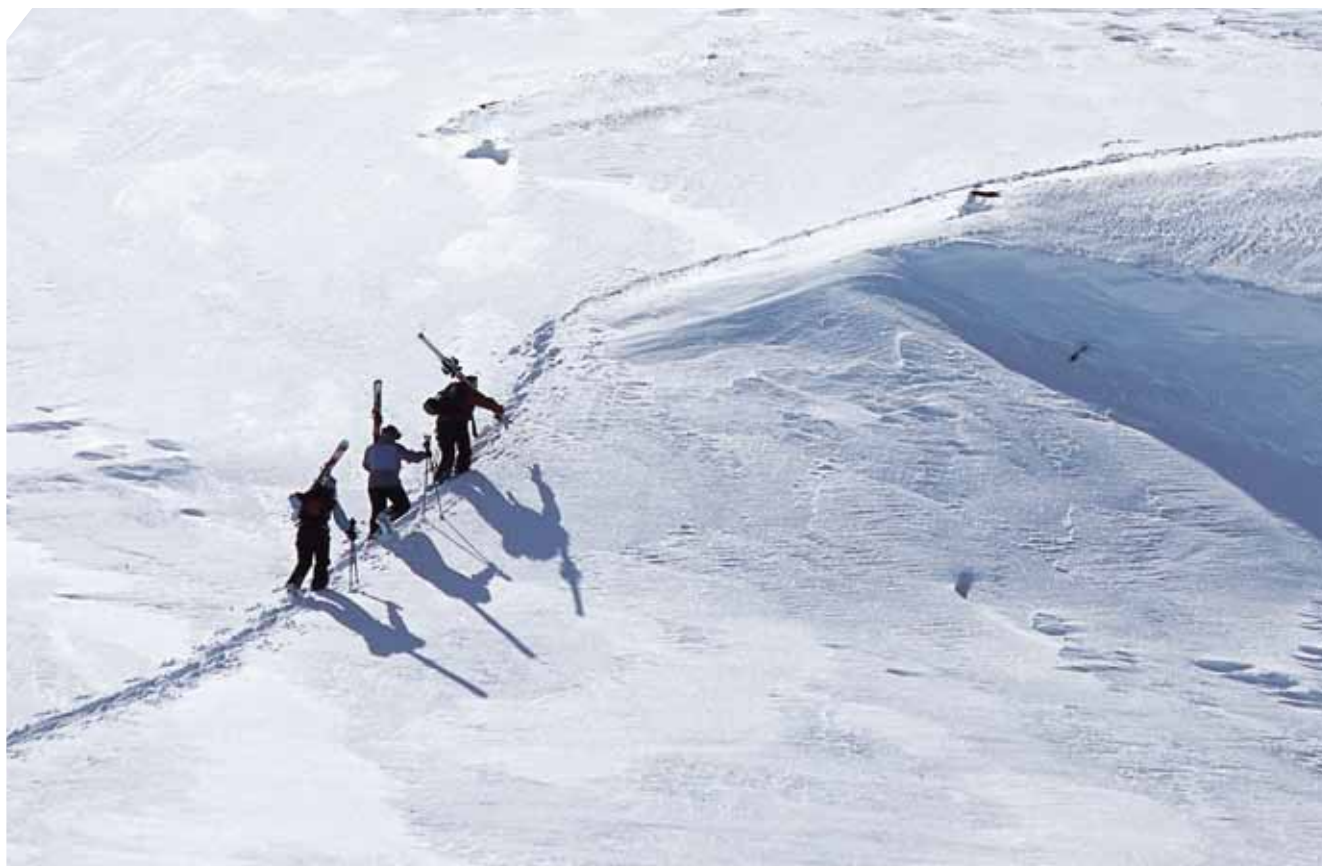
Unendlich viele Möglichkeiten zum Skifahren in Schweden

Im winterlichen Schweden locken aber nicht nur gut präparierte Skipisten und Langlaufloipen, sondern vor allem unendliche Weiten, die mit dem Schneescoter erkundet