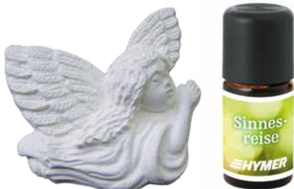
Duftöl & Schutzengelchen