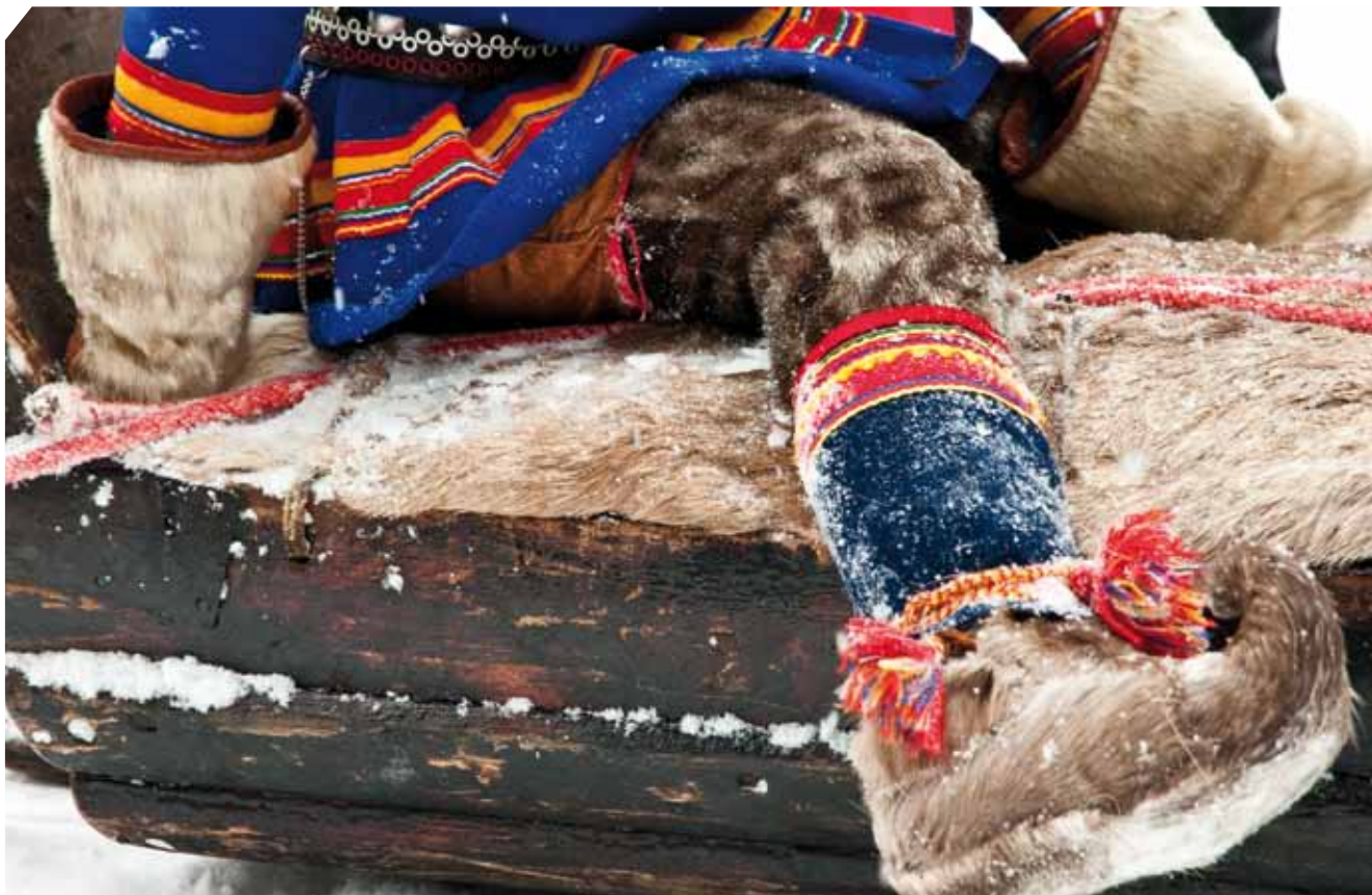
Schwedische Tracht – viel warmes Fell und bunte Wolle

bis endlich der Anker gelöst und das Startzeichen gegeben wird, weiß, dass diese Tiere hier voll in ihrem Element sind. Und wenn die Hunde dann in rasendem Tempo über Schnee und Eis jagen, ist nur noch der gleichmäßige Rhythmus der Hundepfoten, das Knirschen der Kufen und eine fantastische Stille zu hören.