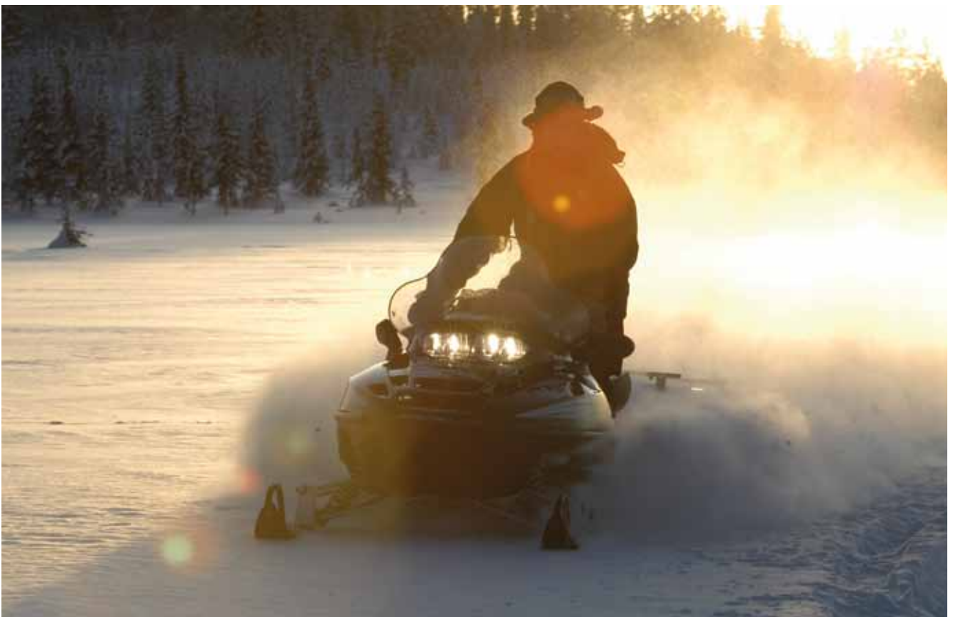
Unzählige Wege sind im Winter extra für Schneescoter reserviert

Ein besonderes Erlebnis ist aber auch die Fahrt mit dem Hun- deschlitten, die heutzutage ebenfalls von vielen Camping- plätzen vermittelt wird. Wer einmal erlebt hat, wie unge- duldig ein Hundegespann aus vielen Kehlen bellt und jault,