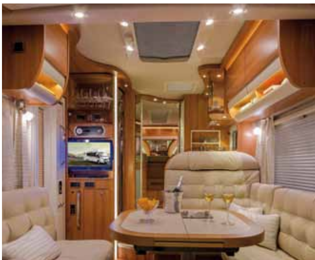
Serien-Highlight: die energiesparende LED-Beleuchtung

Haben Sie Lust, Ihre jahrelange Erfahrung im Caravanning unter Beweis zu stellen und mal aktiv im motivierten HYMER-Team mitzuwirken? Für Messen und Veranstaltungen suchen wir Kunden, die als HYMER-Experten eingesetzt werden um aus eigener Erfahrung zu sprechen. Bewerben Sie sich und beschreiben Sie, auf welchen Gebieten Sie Experte sind. Senden Sie uns eine E-Mail an: experte@hymer.com .